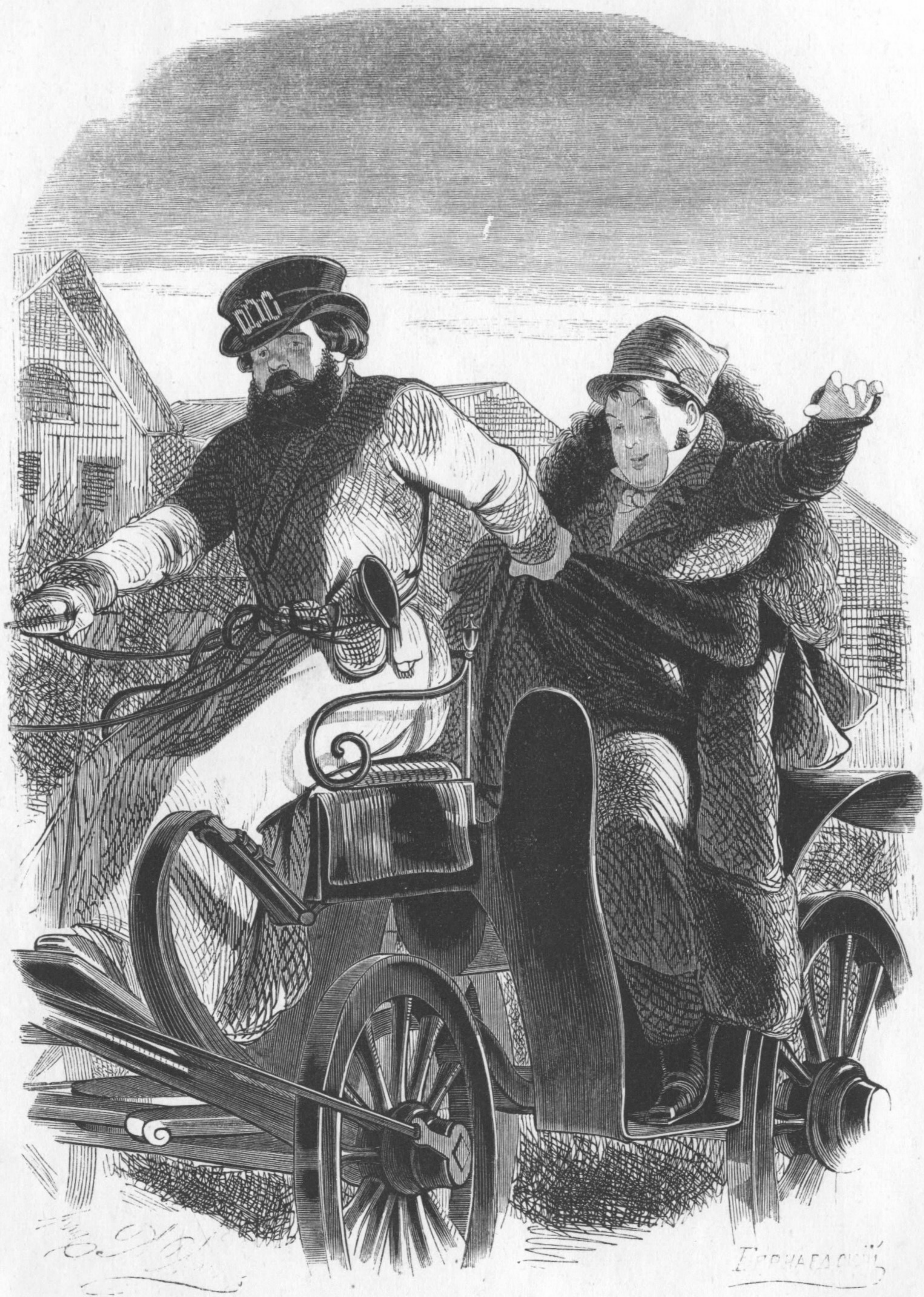
Прокурорскій кучеръ, какъ оказалось въ дорогѣ, былъ малый опытный....